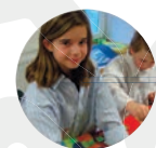
6 Jahre Grundschule