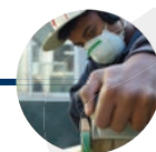
21 Jahre Ausbildung/Studium