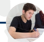
17 Jahre Sekundarstufe II