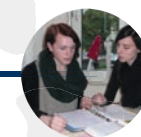
23 Jahre Ausbildung/Studium

Jugendhilfeeinrichtungen mit Privatschule