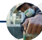
21 Jahre Ausbildung/Studium

Im Rahmen des SBW Lemgo und Detmold wird Jugendlichen und jungen Erwachsenen im Alter von 16 – 23 Jahren in 3 Wohngemeinschaften die Möglichkeit geboten, selbständiges Leben zu üben bzw. zu erlernen. Das Sozialpädagogisch Betreute Wohnen bietet sich vor allem im Nachgang zu einer auslaufenden vollstationären Maßnahme in einer der anderen Einrichtungen der Fachinstitute Blauschek an, da die dort begonnene Fallführung ohne Brüche lückenlos fortgesetzt werden kann. Auf Wunsch können wir den Prozess der Verselbständigung über das SBW hinaus zudem in Form von Fachleistungsstunden beim Übergang in eine eigene Wohnung begleiten.