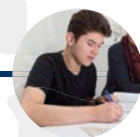
17 Jahre Sekundarstufe II