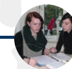
23 Jahre Ausbildung/Studium